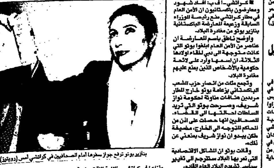
بنازير بوتو تفرج جواز سفرها امام الصحافيين في كراتشي

حتى تتمكن باكستان من استئناف رحلة العودة الى كراتشي للقاء لاقوى الاقتصادية مختلفة، حثب الشعب الباكستاني (المعارض) وحفاظه يتخوضون لخطر مائة ترجة الاستياء العام التي فرضتها مناهضة الحكومة. واستقرت بوتو قاطبة هدها من ان ياتي عام 1999 بتغيير في النظام الحالي